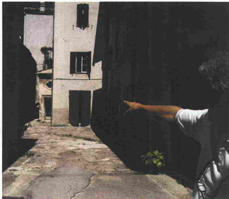
Nei piccoli centri come Visso e Ussita (nella foto) si nota maggiormente l'impatto sociale del sisma

Anche in Valnerina le scosse hanno lasciato cicatrici. Gli antichi bagni di Triponzo, risalenti all'epoca romana e oggi ampliati in un moderno impianto termale, sono scampati al terremoto ma hanno sofferto ugualmente. La struttura, aperta al pubblico il 6 settembre, è rimasta a lungo isolata per un cedimento della provinciale 209, che l'ha resa irraggiungibile. I gestori hanno dovuto cancellare tutte le prenotazioni per il ponte di Ognissanti. Colpiti a freddo, sperano di poter salvare il posto dei 15 dipendenti,