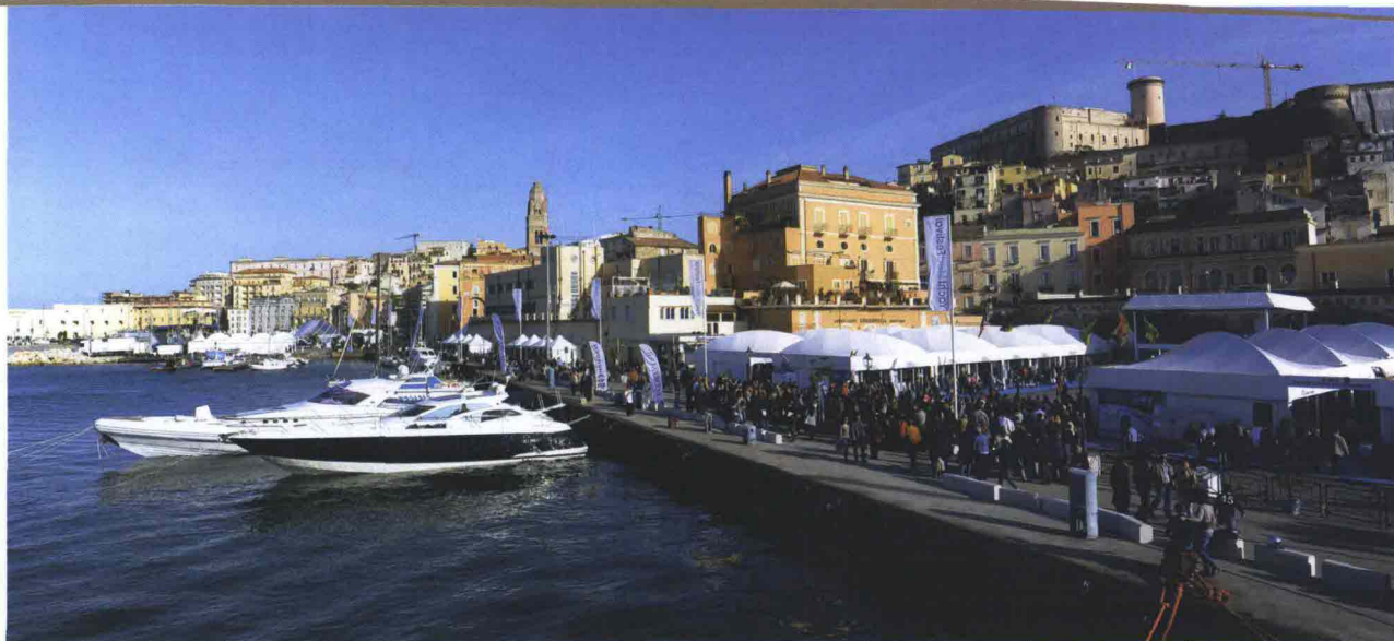
130 BARCHE | aprile 2013

Dobbiamo restituire il mare alla quotidianità delle persone e in particolare dei giovani se vogliamo che questi ne diventino i primi fruitori.