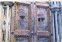
Vandali nel Duomo di Orvieto, fonte battesimale diventa bacheca