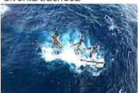
La furia di 'Sandy' affonda il Bounty di Marlon Brando