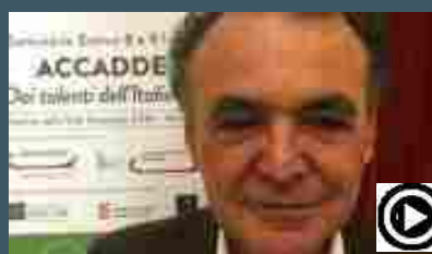
Imprese, Bobba: orizzonte di futuro grazie a produzione di valore