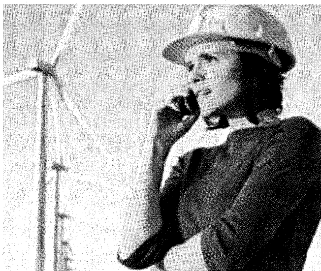
Futuro «rosa» per le energie rinnovabili

Ma quali sono le professioni green più promettenti del mercato del lavoro italiano? Eccole. L'auditor esperto in emissioni di gas serra, lo statistico e il risk manager ambientale, l'operatore marketing delle produzioni agroalimentari biologiche, il progettista di architetture sostenibili e l'esperto del ciclo di vita dei prodotti industriali sono solo alcuni dei profili più innovativi e interessanti.