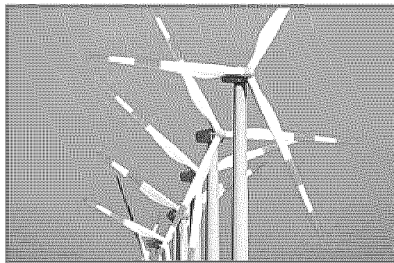
ENERGIE ALTERNATIVE Pannelli solari e pale eoliche al centro degli investimenti di numerose aziende

SI CERCANO AGENTI La richiesta arriva da Enel Green Power per consulenze sulle energie rinnovabili