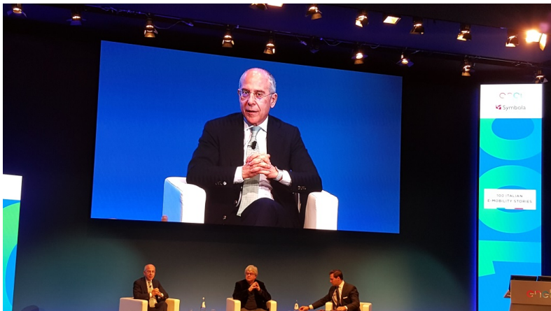
( https://images.wired.it/wp-content/uploads/2017/02/15163847/1487169524_20170215_102954.jpg )