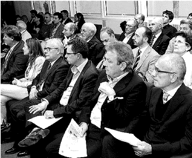
Il pubblico intervenuto alla consegna dei premi Radical green