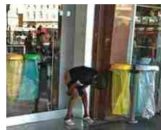
Roma, foto choc su