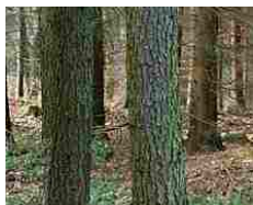
Cerca di fare sesso con