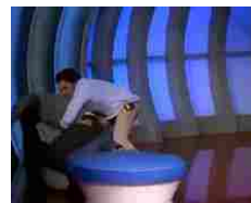
Altro che lieto fine, al