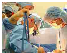
Usa, 17enne super-