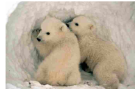
Riscaldamento globale, spariranno un terzo orsi bianchi - Ambiente&Energia