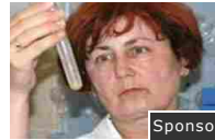
Dimagrirai anche nei primi giorni. Leggi di più...