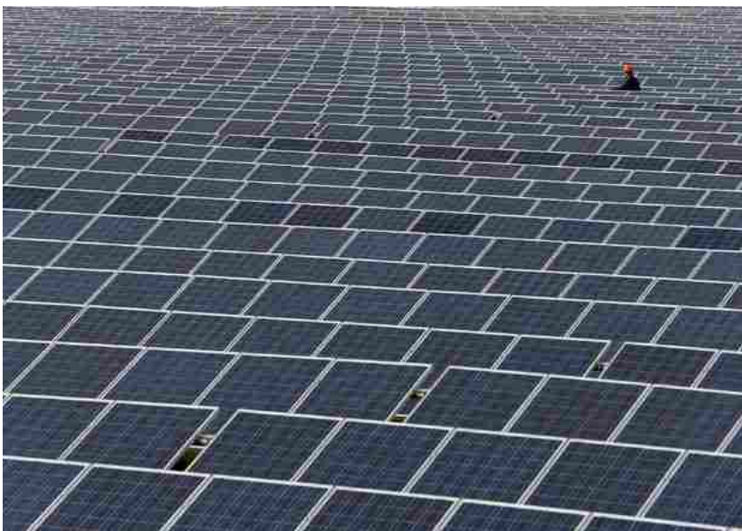
Italia prima in Europa per quota rinnovabili