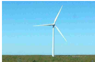
Possibili 139 paesi "100% rinnovabili" entro il 2050 - Ambiente&Energia