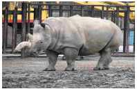
Morto raro rinoceronte bianco, ne restano solo tre - Ambiente&Energia