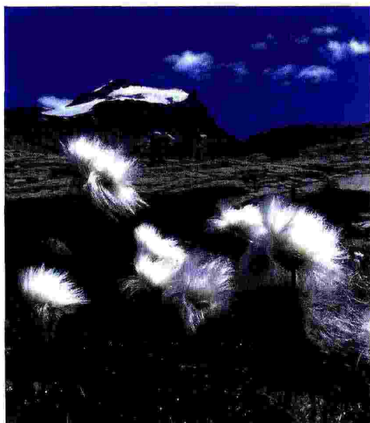
Parco nazionale del Gran Paradiso.

Ma i parchi possono essere occasione anche di sviluppo di un tipo di agricoltura a basso impatto. Nel Parco del Gran Sasso e Monti della Laga al confine tra Abruzzo, Lazio e Marche, è stata ad esempio creata una rete di "agricoltori-custodi" che, coltivandole e scambiandole tra loro, tutelano decine di varietà colturali dal rischio di estinzione: grano "co yu calatro", ceci neri di Camarda, grano solina, patata turchesa, lenticchie nere di Calascio, mais di Capitignano. «Le aree protette italiane possono rappresentare luoghi di eccellenza dove si sviluppano nuove esperienze, anche nell'agricoltura e nelle produzioni tipiche di qualità», spiega Cristina Grandi di AIAB, associazione che insieme al mi-