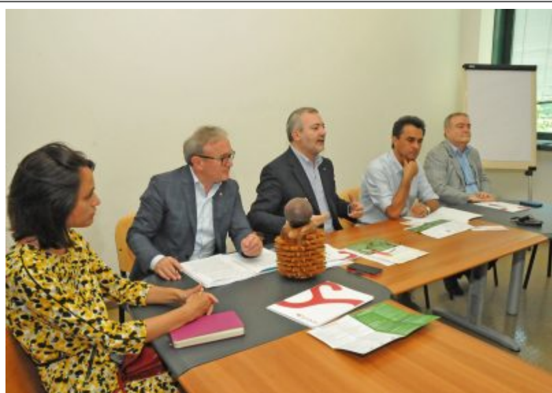
La presentazione ad Ancona degli eventi di Symbola a Macerata e Treia