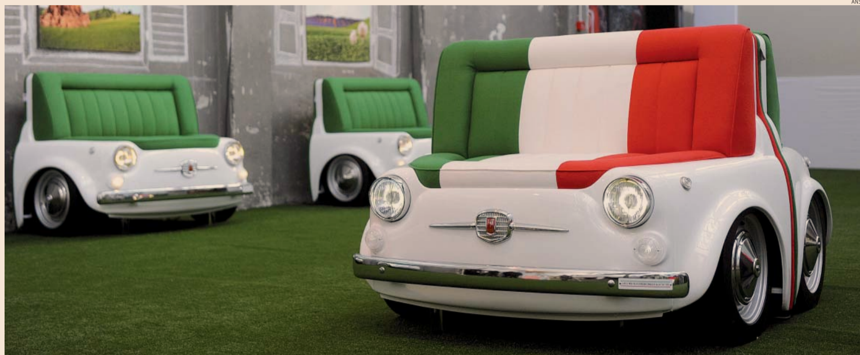
Salone del mobile. Un sofà, un tavolo e una consolle per rendere omaggio alla Fiat 500

Il 23,6% delle imprese sta scommettendo sulle potenzialità della green economy