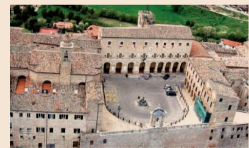
Treia è un comune di 9.740 abitanti della provincia di Macerata. La piazza piacentiale

Le opportunità ci sono: le tecnologie vanno sfruttate appieno, vanno portate a termine le infrastrutture indispensabili a un paese moderno. Si può fare. Non per ogni azione bisogna partire dal nulla: ci sono alcune best practice, ad esempio, che possono essere valorizzate. Come lo Sportello unico per le attività produttive delle Camere di commercio. Con meno di 5 milioni di euro - interamente autofinanziati dalle imprese attraverso il sistema camerale - abbiamo dimostrato di poter garantire, gratuitamente, per oltre 3 mila Comuni, un front-office interamente digitale, efficiente ed omogeneo su tutto il territorio nazionale. Se governo, regioni e comuni lo decidessero, già da domani potremmo metterlo a disposizione di tutte le imprese