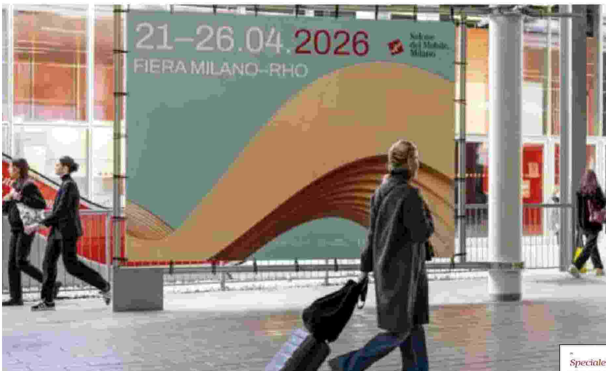
Donatella Sciuto , (a sinistra) rettrice del Politecnico di Milano a un evento al Bibiena. A fianco una immagine del Salone del Mobile di Milano