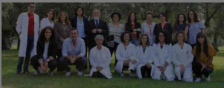
Dip.-Epidemiologia-e-Prevenzione-IRCCS-Neuromed © Personale

P OZZILLI. Una mappa che evidenzia le eccellenze italiane nel campo delle scienze della vita , dalla ricerca alla clinica all'innovazione farmaceutica. "100 Italian Life Sciences Stories", questo il titolo del Rapporto realizzato da Fondazione Symbola in collaborazione con Enel e Farmindustria , ha disegnato il panorama di un Paese protagonista a livello mondiale. E in questa mappa c'è anche l'Irccs Neuromed di Pozzilli.