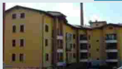
Appartamenti Besana in Brianza Ernesto Teodoro Moneta