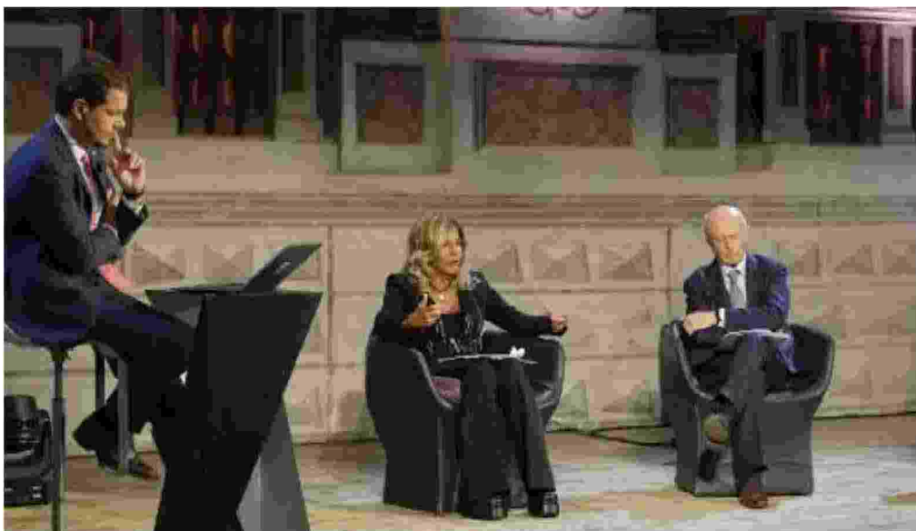
Sul palco in diretta Sky il palco dell'assemblea 2023 con Emma Marcegaglia e Bruno Tabacchi

SkyTg24 porta a Sabbioneta due momenti chiave del suo palinsesto quotidiano: le rubriche SkyTg24 Business e SkyTg24 Economia per una giornata in diretta e trasmetterà sul canale 501 la 79esima assemblea generale di Confindustria Mantova, che sarà moderata e condotta dai