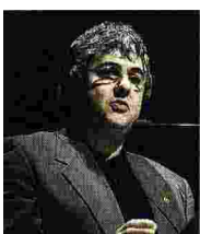
Fondazione Symbola Ermete Realacci