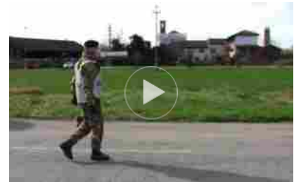
Coronavirus, arruolamento di personale sanitario militare

Tornando al ruolo dell'Italia, il paese “ha tutte le caratteristiche per dare contributo di natura diversa, penso alla sperimentazione sul farmaco anti-artrite a Napoli, o al lavoro sul vaccino che vede coinvolta una azienda di Castel Romano, la Takis che finora ha lavorato solo con propri fondi. Oppure a chi si riconverte producendo mascherine, come la Miroglia, o come l'azienda di Mirandola Teknoline, per un milione al mese di mascherine prodotte. E c'è chi usa le stampanti 3D per tenere in vita e ricondizionare apparecchi per la respirazione assistita, accade in Abruzzo ma anche in Piemonte, magari forzando le regole sui brevetti per non far morire della gente. La nostra capacità di rispondere vale se agiamo però come paese. Finora, a parte alcune polemiche inutili, e una percentuale di cretini a mouse libero, la risposta, nelle condizioni che stiamo affrontando, è stata matura. Inutile nascondere, tutti