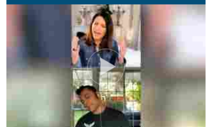
Tiziano Ferro e Laura Pausini cantano “Non me lo so spiegare”