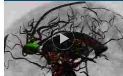
La robotica medica in campo contro i tumori al cervello