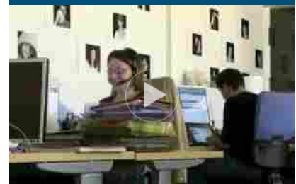
In vigore decreto Cura Italia, slitta referendum sui parlamentari