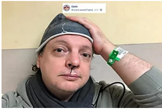
Dado rinviato a giudizio: "Grottesco, secondo loro