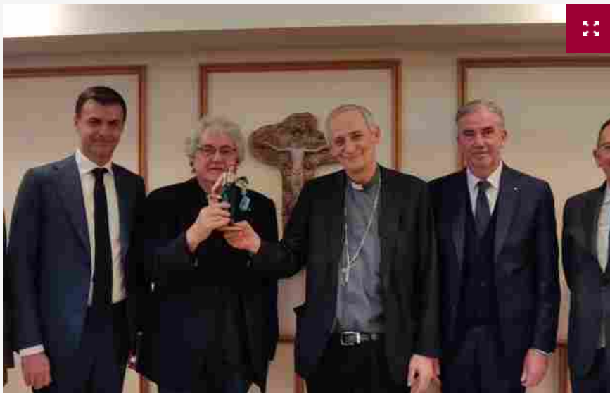
Green e sostenibile, tra piante e fiori: la florovivaista personaggio del presepe 2022

Una "nuova" figura, simbolo delle imprese impegnate nella cura e nella manutenzione del nostro patrimonio verde e della biodiversità: è la florovivaista il personaggio del presepe 2022 secondo Fondazione Symbola , Confartigianato e Coldiretti, che consegnano la statuina al Cardinale Matteo Zuppi, presidente Cei.