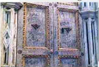
Vandali nel Duomo di Orvieto, fonte battesimale diventa bacheca