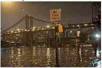
'Sandy' paralizza New York. La Grande Mela si piega all'uragano