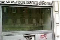
A Roma la protesta del No-Monti-day