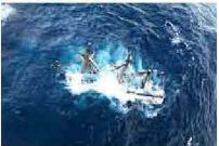
La furia di 'Sandy' affonda il Bounty di Marlon Brando