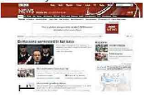
La condanna di Berlusconi apre i siti dei media internazionali