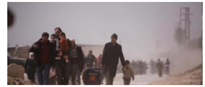
Siria: bombe, morti e un esodo senza fine