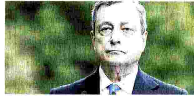
Premier. Mario Draghi