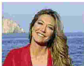
Tessa Gelisio Autrice e conduttrice