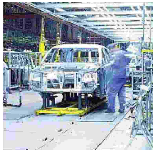
Automotive Uno dei settori chiave è quello delle auto

● Symbola è la fondazione che promuove e aggrega «le qualità italiane», dalle istituzioni alle aziende