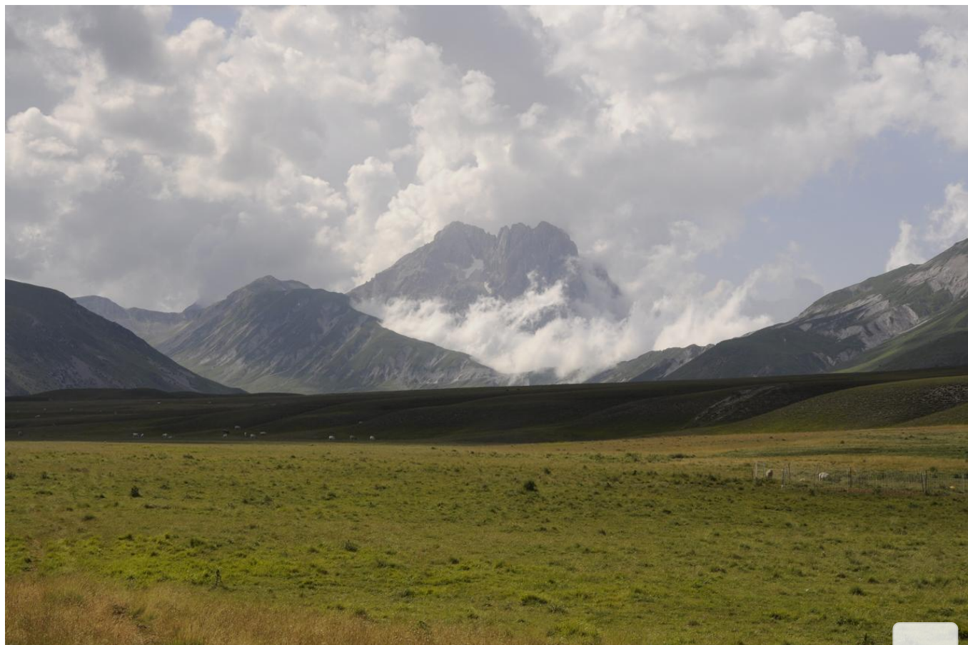
Campo Imperatore e le vette del Gran Sasso d'Italia

7 Aprile 2021 in Articoli Recenti , Le Vie della Natura , Servizi