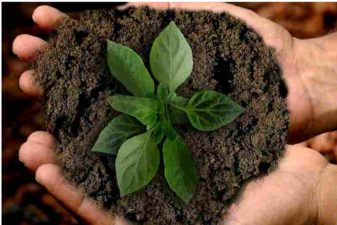
Presentato il rapporto GreenItaly 2021 - Foto © www.giornaledibrescia.it

La sostenibilità come obiettivo da qui ai prossimi cinque anni, con il Pnrr come motore della transizione verde dell'Italia e del Bresciano .