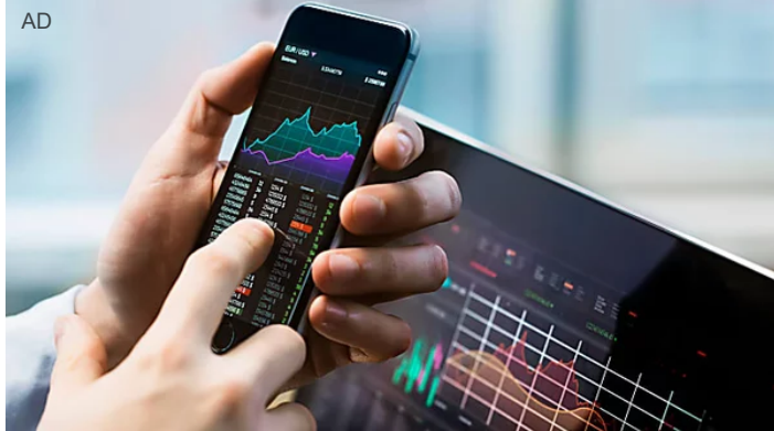
Unisciti a eToro e Investi adesso nei brand che conosci e ami con lo 0% di commission