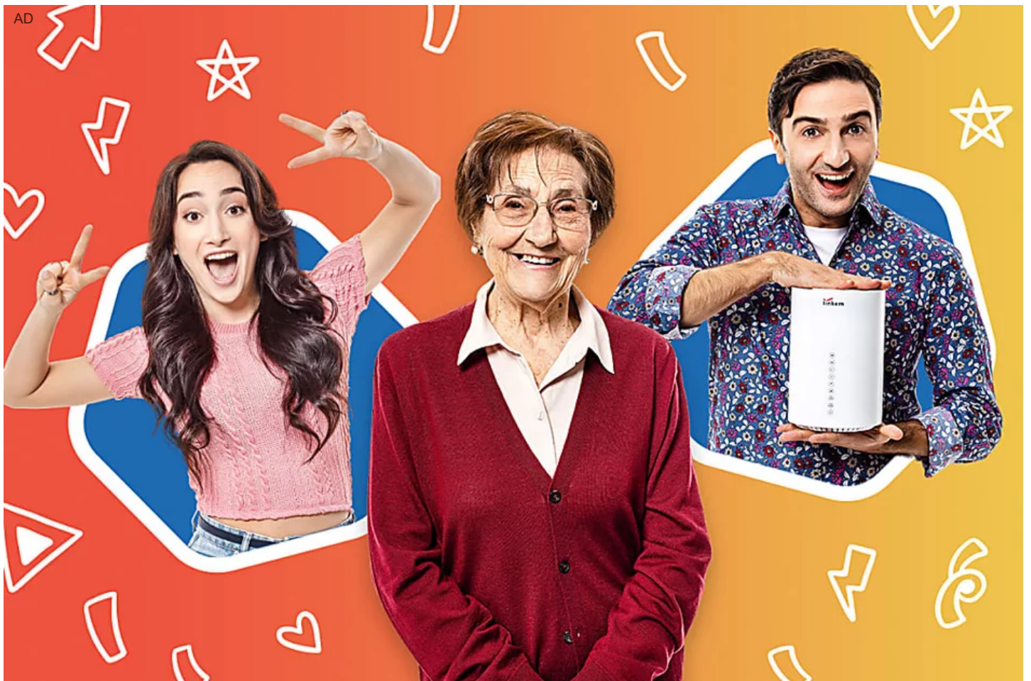
Naviga senza linea fissa e senza limiti con Linkem a 19,90€/mese per 12 mesi