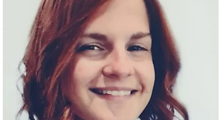
Dottorassa scomparsa in Trentino, la famiglia chiede aiuto - Cronaca