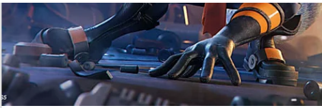
Gioca con Rivet, nuova misteriosa Lombax