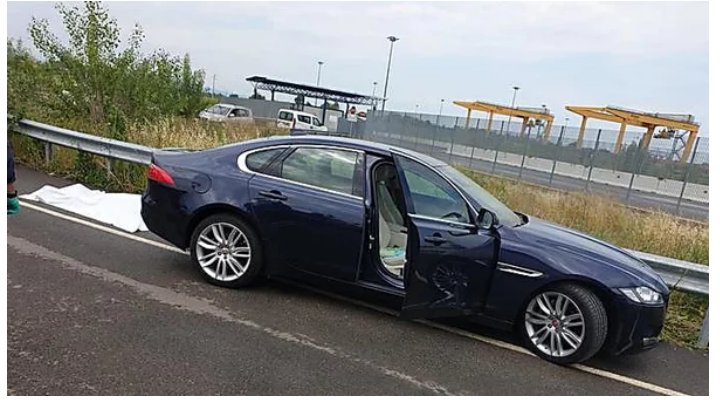
Ucciso dalla propria auto a Modena