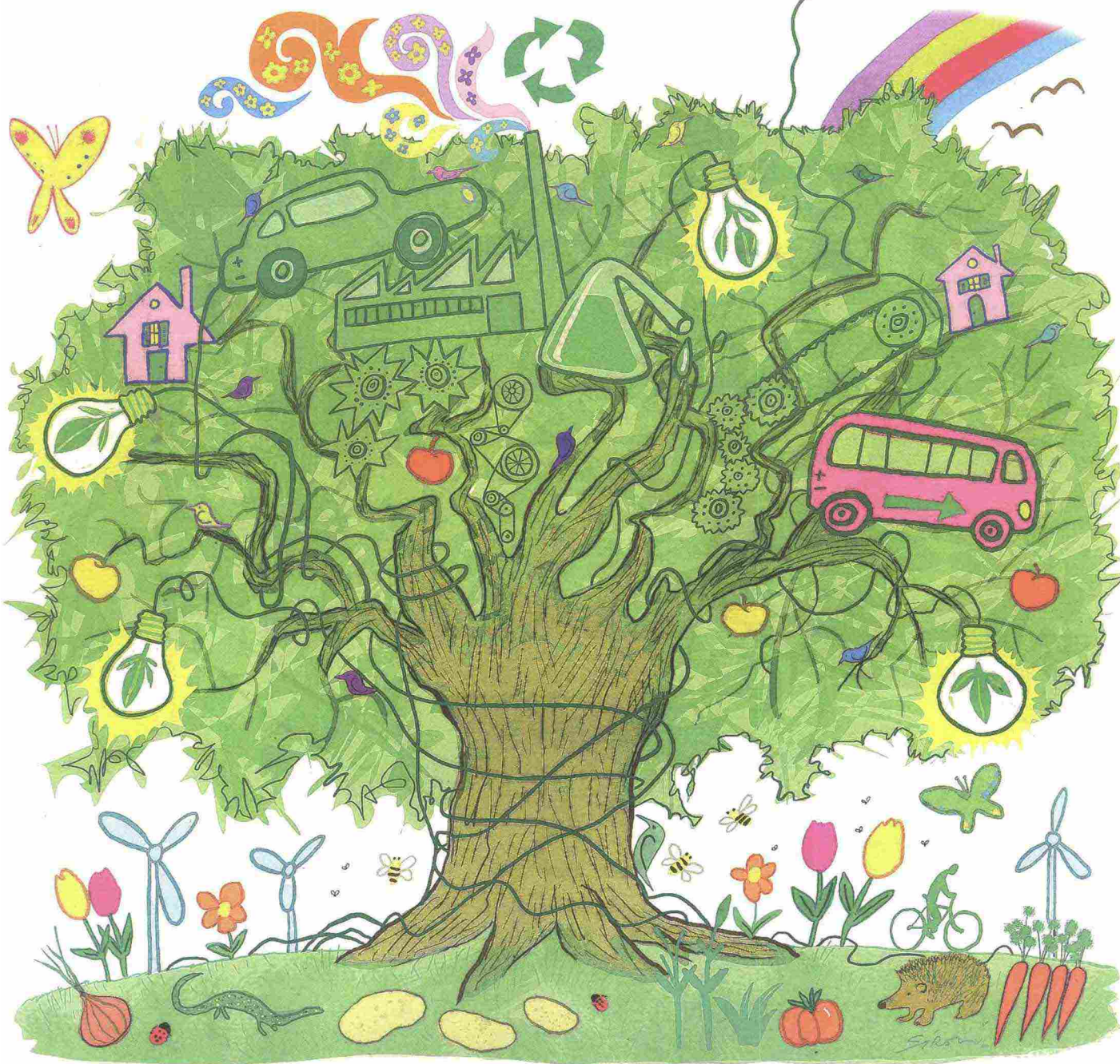
ILLUSTRAZIONE DI FABIO SIRONI

Non è solo una moda, non solo una scelta etica Ecco perché la sostenibilità funziona (al Nord)