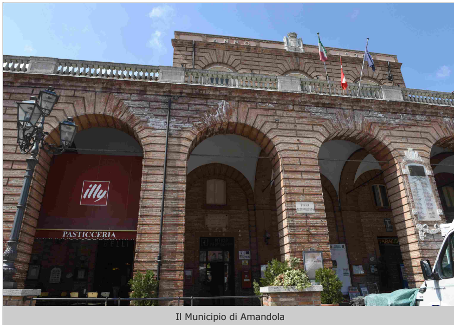
Il Municipio di Amandola

Parte venerdì 23 settembre da Amandola, dopo aver rinviato l'appuntamento di Fabriano la scorsa settimana a causa della tragedia che ha colpito le Marche, Next Appennino Lab il programma di attività di Fondazione Symbola in attuazione del Protocollo d'intesa tra il Commissario Straordinario Sisma 2016, il Coordinatore della struttura tecnica di missione Sisma 2009, il Dipartimento Casa Italia e le Fondazioni Symbola , Aristide Merloni, Magna Carta, gli Istituti Adriano Olivetti e Censis e le Associazioni Legambiente, Federtrek ed Uncem.