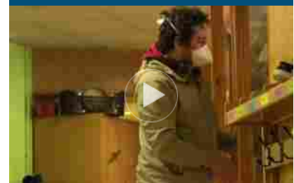
Mascherina obbligatoria negli "spazi pubblici chiusi" in Francia