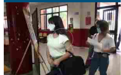
Maturità, un diplomato su due prende un voto superiore all'80