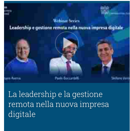
La leadership e la gestione remota nella nuova impresa digitale