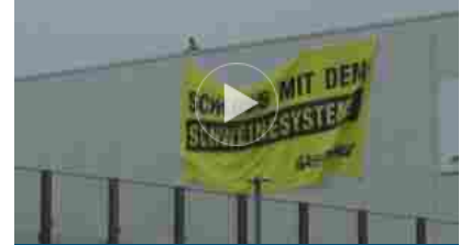
Greenpeace sul tetto macello Toennis: "Basta col porco sistema"