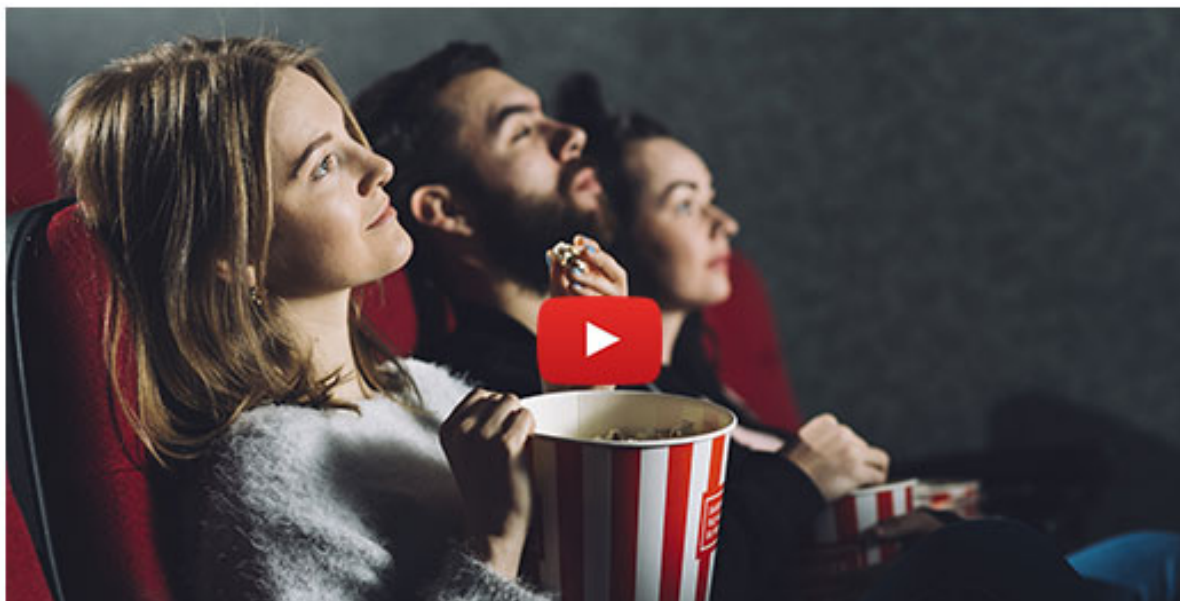
Tg Cinema, edizione del 24 marzo 2021