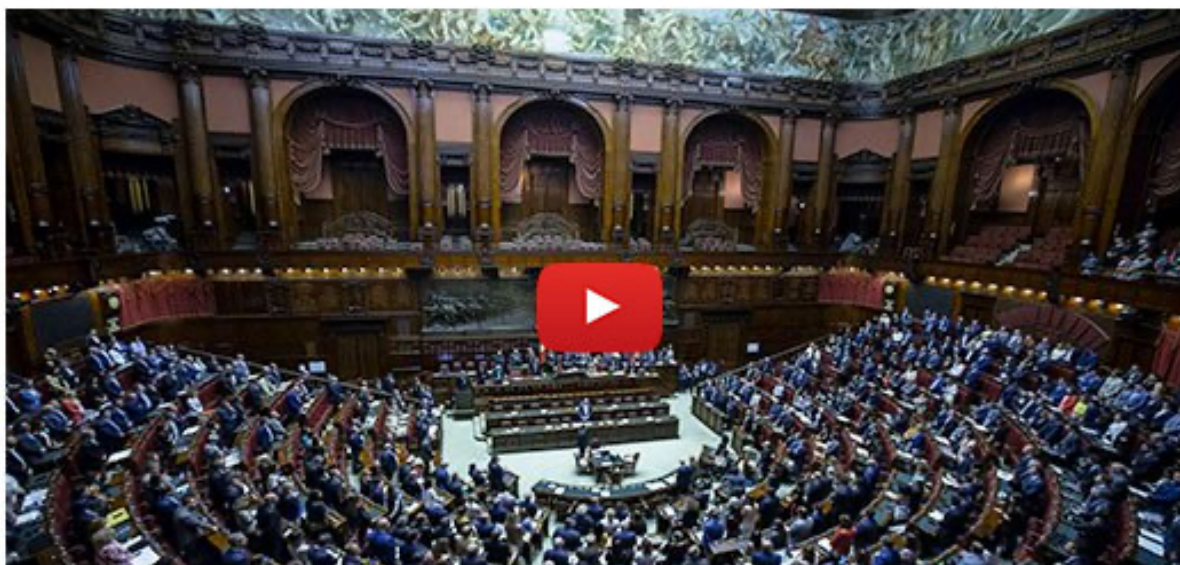
Tg Politico Parlamentare, edizione del 23 marzo 2021