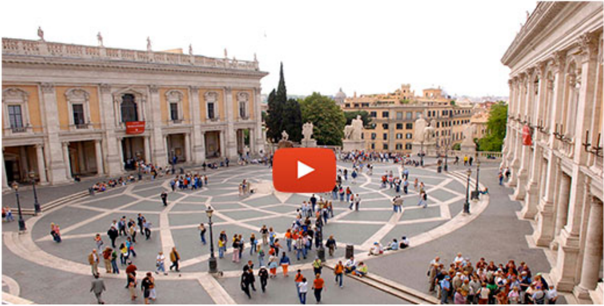
Tg Lazio, edizione del 24 marzo 2021