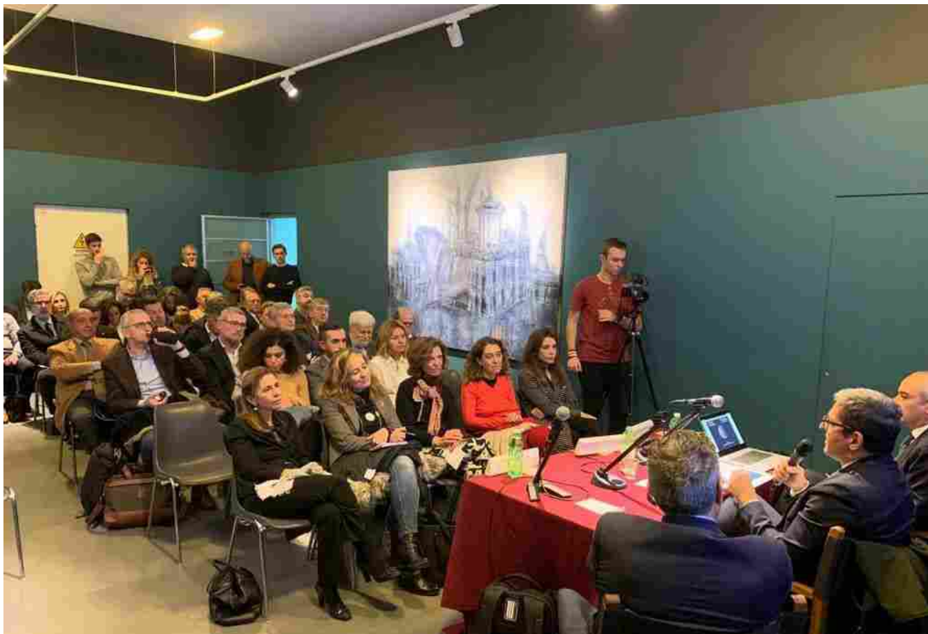
UCINA Confindustria Nautica: Convegno "Genova, Capitale della nautica"

Si è tenuto oggi 26 novembre a Genova, presso il Galata Museo del Mare, il Convegno "Genova, Capitale della nautica", organizzato da UCINA Confindustria Nautica nell'ambito degli appuntamenti legati a Genova Capitale della Cultura d'Impresa, il progetto lanciato da Confindustria, con il patrocinio del Ministero dei Beni e delle Attività Culturali, dedicato alle Associazioni del Sistema, per ribadire l'impegno a sostegno della consapevolezza del valore sociale e identitario, oltre che economico, della cultura del fare impresa.