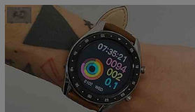
L'incredibile Smartwatch con ECG che sta conquistando l'Italia E20 Smartwatch