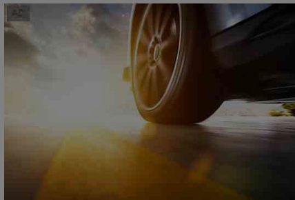
I prezzi degli pneumatici online potrebbero sorprenderti Pneumatici | Link Sponsorizzati