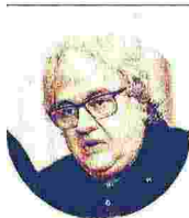
ERMETE REALACCI Presidente della Fondazione Symbola